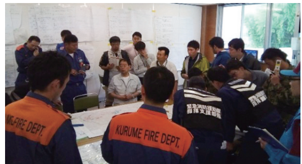
災害時における活動方針を決定する会議の様子