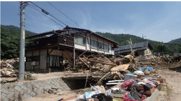
平成30年7月豪雨での広島県呉市における被害

市町村長が、災害の警戒段階から発災後に至る重要な局面で、的確かつ迅速な判断・指示を行えるよう、市町村長の災害対応力の強化を図るための研修です。今回は風水害をテーマに、各局面において市町村長が特に留意すべき事項を確認しながら、報道発表のシミュレーション等も含めた実践的なスキルの向上を図ります。